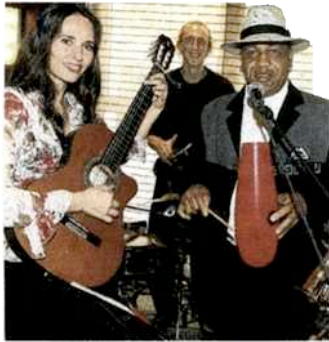
Das Cuba Austria Quartett brachte jazzig-südamerikanische Stimmung ins NH-Hotel.